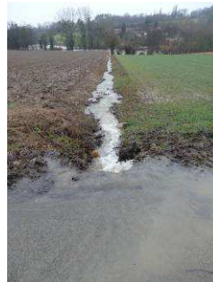
Ravinement et apport de matériaux au niveau de la voirie