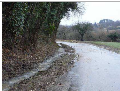
Fossé en charge et avaloir obturé